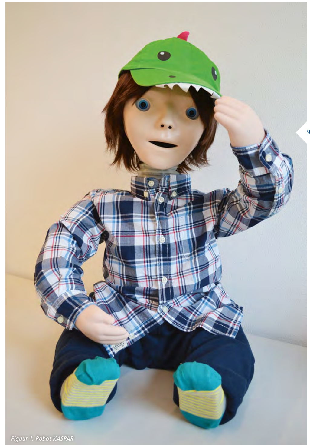
Figuur 1. Robot KASPAR

Autisme manifesteert zich op een spectrum; elk kind is anders, heeft andere behoeftes en niet elk heeft kind baat bij dezelfde (set) interventie(s). Wat voor de één gunstige invloed heeft, kan averechts werken voor de ander. Interventies die gebruik maken van robots zouden een mogelijke bijdrage kunnen leveren binnen de therapie en/of het onderwijs voor kinderen met ASS. Robots hebben een aantal kenmerken die waardevol kunnen zijn voor deze doelgroep. Voorbeelden hiervan zijn voorspelbaarheid, belichaming en interactiviteit. Daarnaast kunnen robots ook heel gemakkelijk verschillende rollen aannemen.