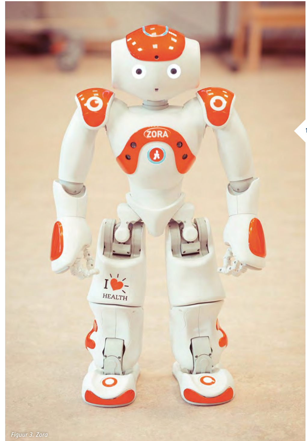
Figuur 3. Zora

De robot waarmee onderzoek is gedaan bij kinderen met een fysieke beperking is robot ZORA. Deze robot is een softwaretoepassing ontwikkeld door QBMT voor de NAO-robot van producent Softbank Robotics. ZORA heeft een lengte van 58 centimeter, is een mensachtige robot en kan worden ingezet binnen de (ouderen)zorg, retail en educatie.