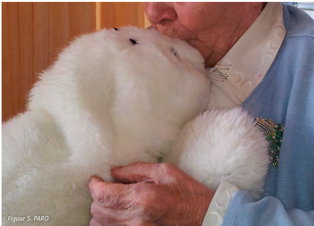
Figuur 5. PARO